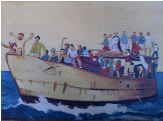
Los que se fueron

Vivimos momentos álgidos y el arte es el testigo más exacto que podemos encontrar. Con las mismas manos de castrar cerdos, Pedro Ramos nos ofrece su peculiar visión del tiempo que le tocó padecer.