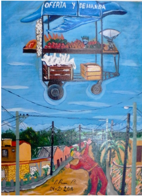
Oferta y demanda

En su refugio y con la libertad de conducir sus piezas en un tablero cada vez más desigual, el autor de más de un centenar de obras, cree en la contundencia del arte para desafiar. Y por esa corriente se desplaza.